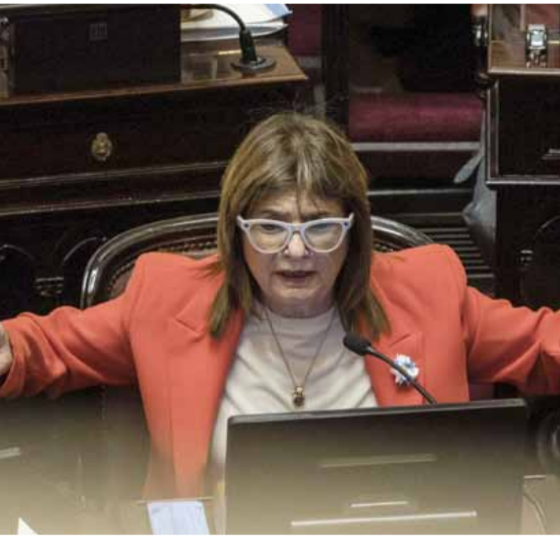
En el recinto. Bullrich, la semana pasada, durante el debate en el Senado.

Además, adelantó que se prevé la creación de una junta médica integrada por hospitales públicos y centros de reconocida trayectoria para resolver las “controversias” que puedan surgir entre empleadores y empleados en torno a las licencias. “Hoy en día, al año el trabajador tiene reserva de un año del cargo y a los dos años le aplica el 245, que es la indemnización. Esto ya estaba, lo único que cambió es un porcentaje justamente por las mentiras de las mafias. En ningún lugar la Ley de Contrato de Trabajo distinguía entre enfermedades severas y no severas, y por ahí un empleado se tomaba un año por algo que no era severo”, insistió Bullrich. -DIB-