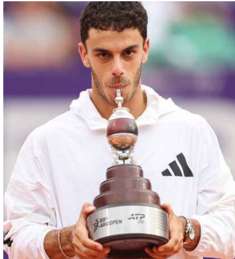
En sus manos. El campeón posa con el trofeo.

El porteño mostró variantes, cargó el juego sobre la derecha de su rival y supo escapar de momentos comprometidos, como un 15-40 en el octavo game. Sin titubeos al cerrar, se-