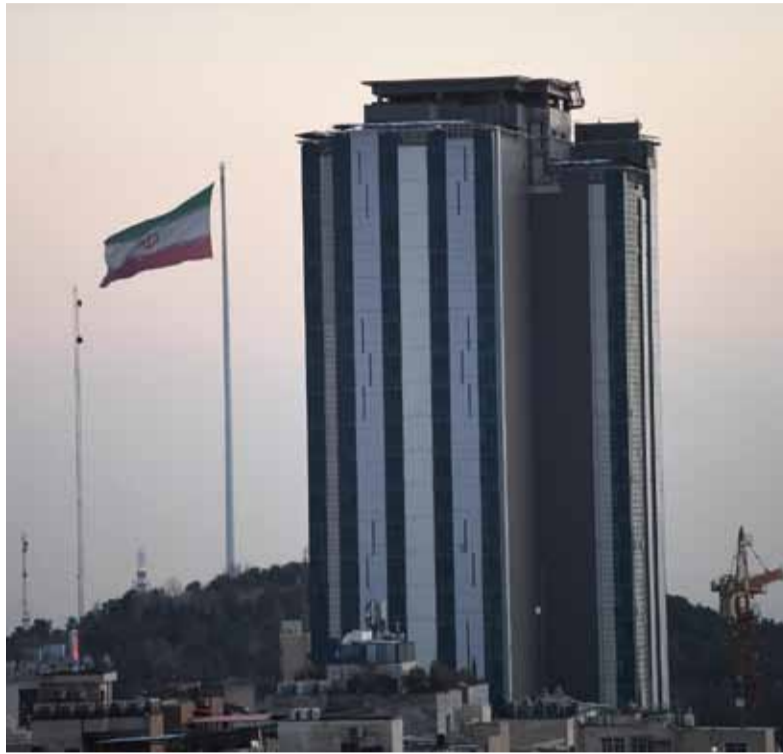
Díálogo. El presidente Masoud Pezeshkian ordenó a comienzos de mes el inicio de negociaciones con EE.UU.

El secretario de Estado estadounidense, Marco Rubio, dijo que Trump prefiere la diplomacia y una solución negociada. "Nadie ha logrado jamás un acuerdo exitoso con Irán, pero lo intentaremos", declaró Rubio en una conferencia de prensa en Bratislava. - XINHUA -