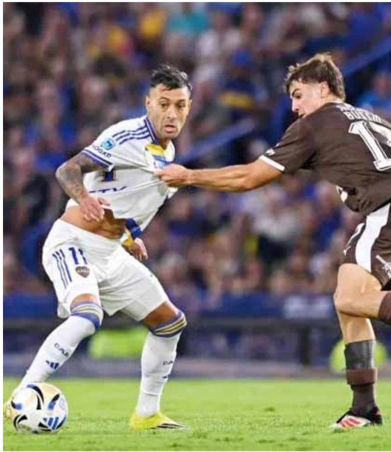
Tedio. Otro partido en casa para el olvido del "Xeneize".

El equipo local respondió a los 32 minutos con un centro desde la derecha que encontró a Lucas Janson en el área. El cabezazo exigió una muy buena reacción de Matías Borgogno, en la ocasión más concreta del "Xeneize" durante la primera mitad. Sin embargo, el conjunto dirigido por Claudio Úbeda no logró sostener la presión ni involucrar con continuidad a Leandro Paredes en la gestación de juego. Las imprecisiones y la falta de profundidad marcaron el cierre del primer tiempo, que terminó con silbidos desde las tribunas.