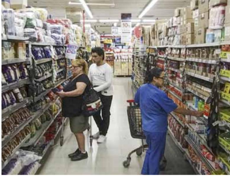
Oficial. El Indec informó un 2,9% de inflación en enero, 32,4% de alza interanual.

En enero, subieron hasta 15%, aunque las carnicerías buscan contener el aumento y no trasladarlo en su totalidad,