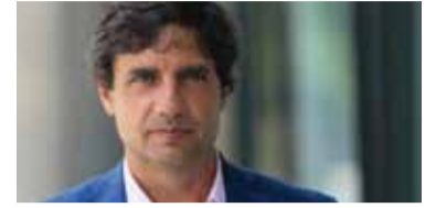
Hernán Lacunza, exministro de Economía.

Hernán Lacunza, exministro de Economía, aseguró ayer que “el Gobierno evitó una crisis mayor”, pero aclaró que “ahora enfrenta el desafío de reactivar una economía que está estancada”. Si bien destacó la estabilización macroeconómica lograda tras atacar el déficit fiscal y la emisión monetaria, advirtió que la desinflación se desaceleró y que la actividad muestra fuertes disparidades sectoriales.