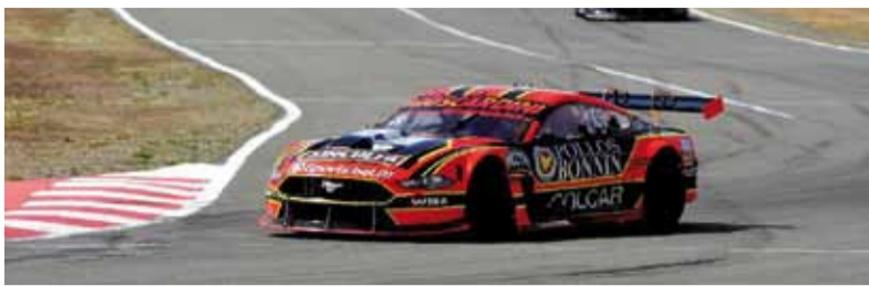
Veloz. Estreno soñado para el platense.

Heredó el triunfo en El Calafate tras la exclusión de Santero y se convirtió en el 228º ganador en la historia de la categoría.