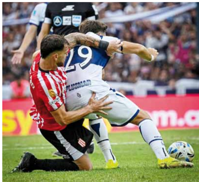
Dureza. El "Pincha" apeló al rigor ante la permisividad arbitral.

Gimnasia y Estudiantes empataron 0-0 en la quinta fecha del Torneo Apertura. Muslera fue clave para la visita, que se fue conforme con el punto.